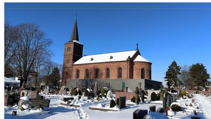
Förderverein für das Pfarr- und Jugendheim St. Dionysius Rheidt e.V.

Auch die seit Jahren sehr gut angenommene Kalenderaktion mit Rheidter Motiven ermöglichte die Beteiligung an vielen Maßnahmen.